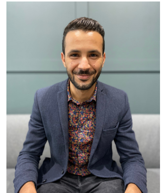
Développeur en IA

Notre équipe présente des profils complémentaires : expertise IA, métier et juridique afin d'accompagner et développer des solutions métier innovantes et performantes pour les acteurs de la gestion de sinistres.