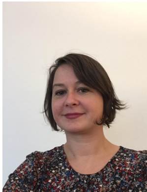
Avocat Juriste R&D