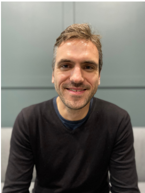
Juriste en protection juridique